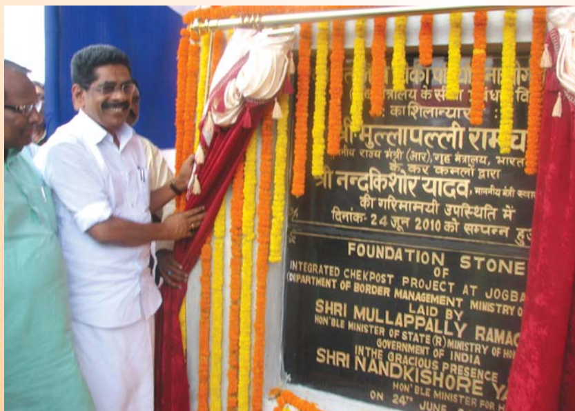
Shri M. Ramachandran, Hon'ble Minister of State, MHA, Govt. of India laid the foundation stone of Jogbani ICP in presence of Shri Nand Kishore Yadav, Hon'ble Health Minister, Govt. of Bihar.

Land for the ICP at Birgunj is to be handed over to the Consultant/Contractor by 15 th July 2010. Work will start soon thereafter.